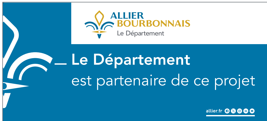
Bâche barrière Vauban 1,80 x 0,80 m

VALIDATION AUPRÈS DU SERVICE COMMUNICATION